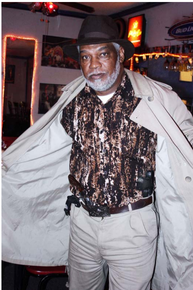
Alltid beredd ifall han får ett tips; handklovar och två revolverar i bältet.

En lite kul grej. Hasse Ekestang och jag hade ju varit i Tunica två dagar innan på Bobby Blands 80-årsfirande. Det visade sig att Melvin och Callie också varit där.